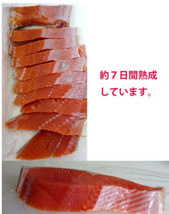
〈ロシア産 紅鮭切身 (半身分)〉