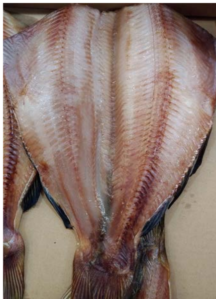
〈アメリカ産 開シマホッケ〉

大きく良質の脂が大変美味しい品質のよいものだけを厳選しました。焼くと溢れ出す脂と厚い身が美味しく、お勧めです。