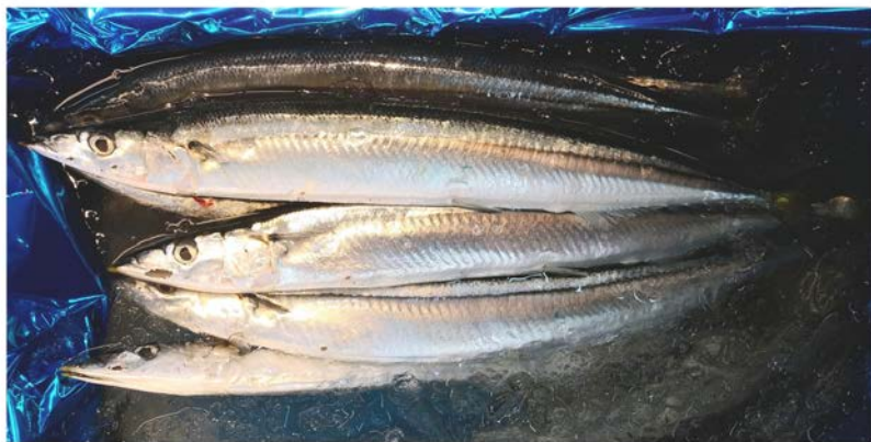
生サンマ (根室他産)

秋を代表する味覚のひとつ秋刀魚は、日本人には馴染みのある魚です。旬の時期になると、塩焼きや、お刺し身として食べられる魚として人気があります。