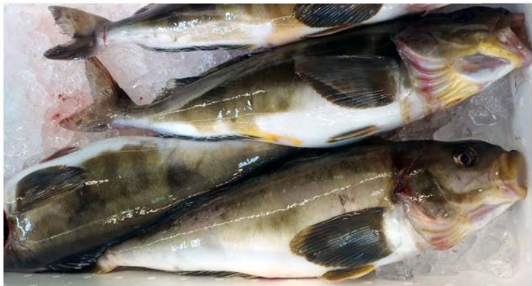
生ホッケ (羅臼他産)

今が1番脂がのっている最高の状態のホッケです。塩焼きやフライ、チャンチャン焼きでも美味しくいただけます。