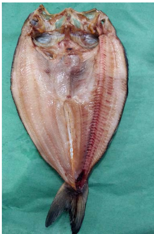
〈羅臼産 開真ホッケ〉

真ホッケ特有の味わい深い風味が特徴で、ほどよい身しまりで脂のりもよく、身もホクホクで美味しく、お勧めです。