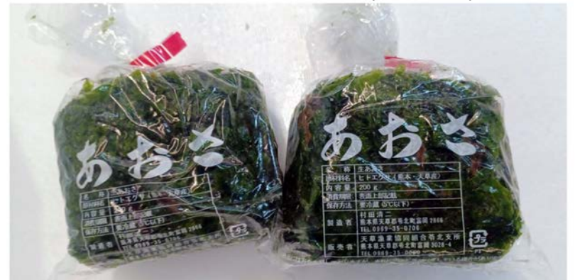
生アオサのり(熊本産)

春にされる天草のあおさは、磯の香りが豊かで、お吸い物・味噌汁・天ぷらなどがおすすめです。