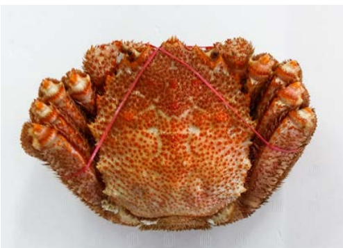
冷凍ボイル毛ガニ