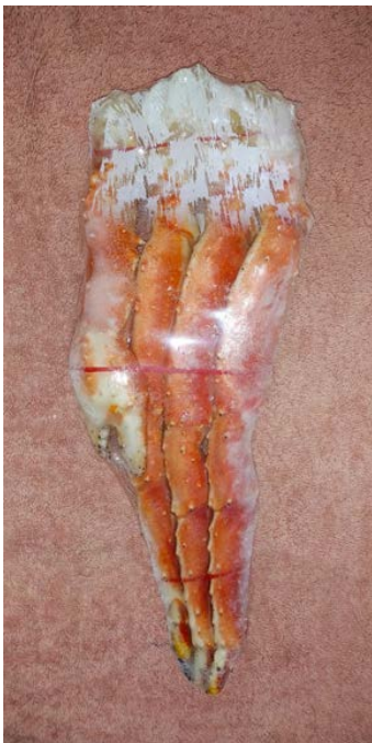
冷凍ボイルタラバ足